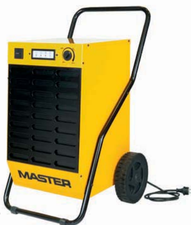
DH 44 DH 62 DH 92