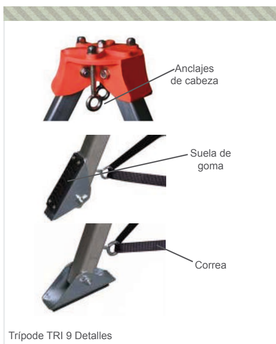
Trípode TRI 9 Detalles