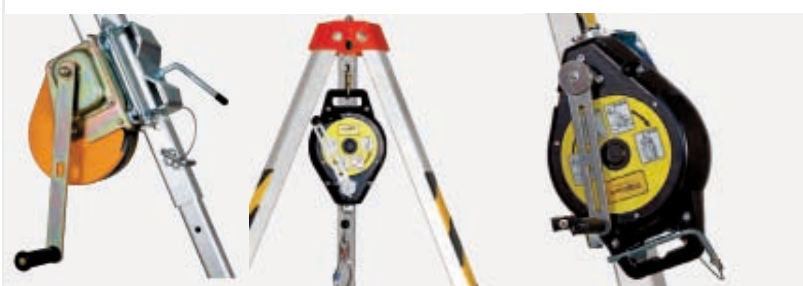
RES 502 colocado en la pata del trípode ANR 6 - ANR 20 - ANR 30 - ANRW 300 conectado en la cabeza del trípode ANRW 300 conectado en la pata del trípode con el adaptador TRI 171