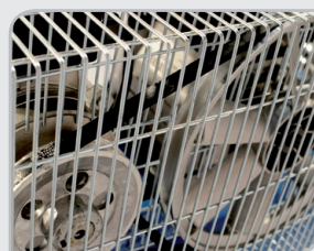
Malla metálica de protección Robustez y seguridad en nuestros equipos.