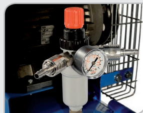
Regulador de presión Enchufes rápidos. Filtro de condensación. Manómetro.