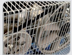
Malla metálica de protección Robustez y seguridad en nuestros equipos.