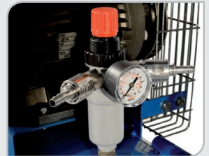
Regulador de presión Enchufes rápidos. Filtro de condensación. Manómetro.