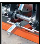
Despegue automático de la placa térmica