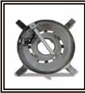
Cuello porta bridas