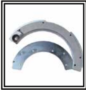
Reducciones Ø 75 ÷ 225 mm