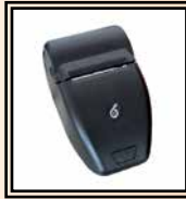
Impresora serial portátil