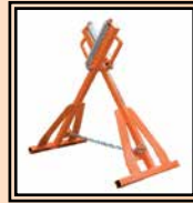
Rodillo HS 250

Y: Reducciones Ø 2" ÷ 8" IPS; 3" ÷ 8" DIPS