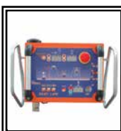
Panel de control con GPS