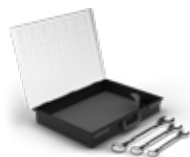
BS-110-TOOLBOX Maletín con llaves inglesas de 13 | 17 | 19 mm