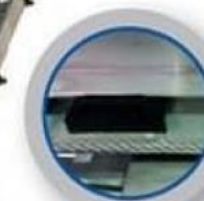
LIBRE DE MANTENIMIENTO